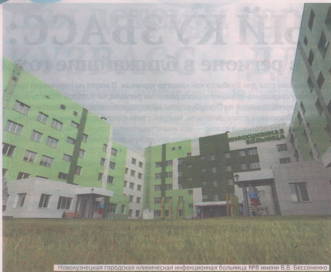
Новокузнецкая городская клиническая инфекционная больница №8 имени В.В. Бессоненко