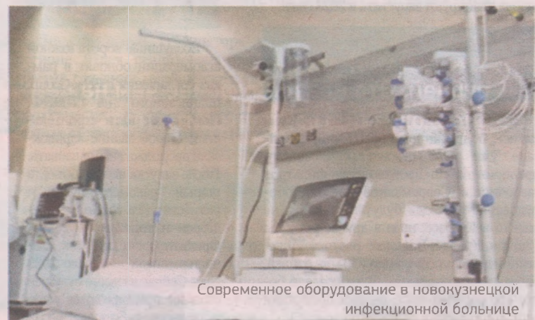
Современное оборудование в новокузнецкой инфекционной больнице

В целом в южной агломерации Кузбасса активно продолжается ремонт и строительство нескольких медицинских учреждений. В Междуреченске возводится семизэтажный комплекс городской многопрофильной больницы на 186 коек. Ее открытие запланировано в конце 2022 года. На финальной стадии — реконструкция здания под участковую больницу в поселке Каз Таштагольского района. В 2021 году начнется капремонт трех подразделений Новокузнецкой городской детской клинической больницы им. Малаховского и поликлиники Прокопьевской детской больницы, отделений Таштагольской районной больницы в Темиртау и Шерегеше, ремонт ФАПа и врачебной амбулатории в Прокопьевском округе.