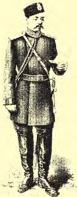
Форма одежды уездного исправника (утверждена 15 марта 1884 г.)