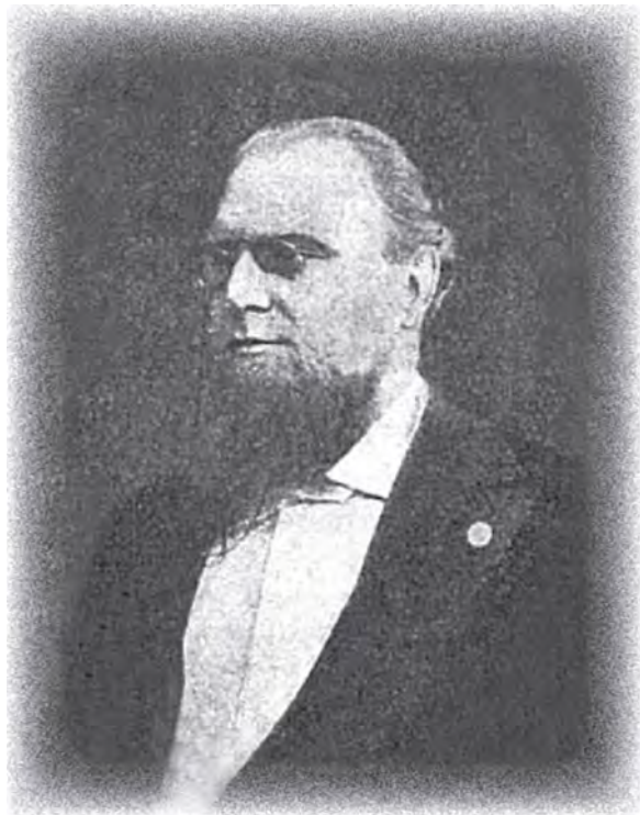
Рис. 15. Леонид Петрович Блюммер, литератор. Фото 1870-х гг. (Из: Деятели..., 1928)