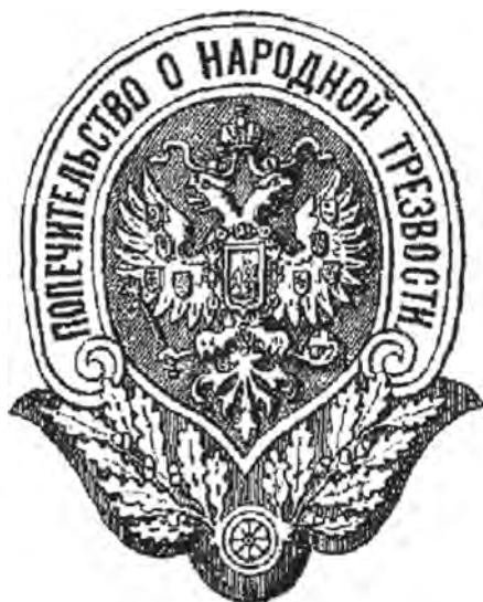
Рис. 12. Знак для членов «Попечительства о народной трезвости» (утверждён 10 февраля 1895 г.)